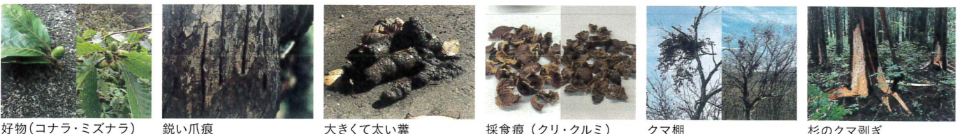
好物(コナラ・ミズナラ)

POINT 2 クマの痕跡に気を付ける クマの好物である どんぐり類(コナラ・ミズナラ) や クルミ、ミズキ、カキ やその周辺には、 爪痕や糞、採食の痕跡 が残っています。また、木の上で枝を手繰り寄せて木の実を食べた跡の “クマ棚” など クマの活動のサインを見逃さない ことが重要です。