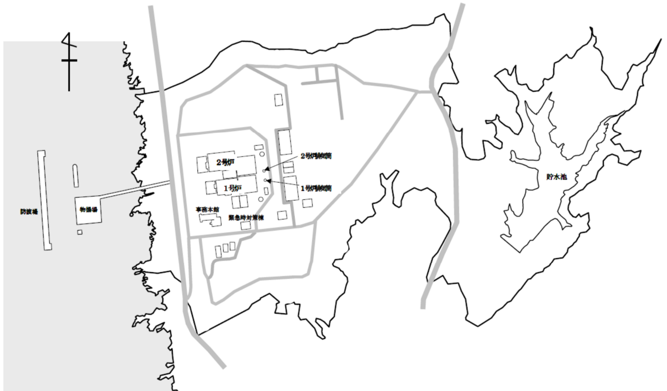
図4-1 志賀原子力発電所の敷地付近の概略地図

※ 具体的な廃止措置対象施設の範囲は廃止措置計画において明確にし，認可を受けるものとする。