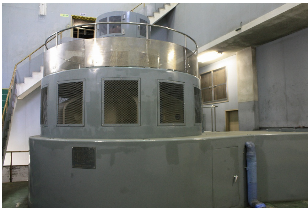
池の尾発電所 発電機