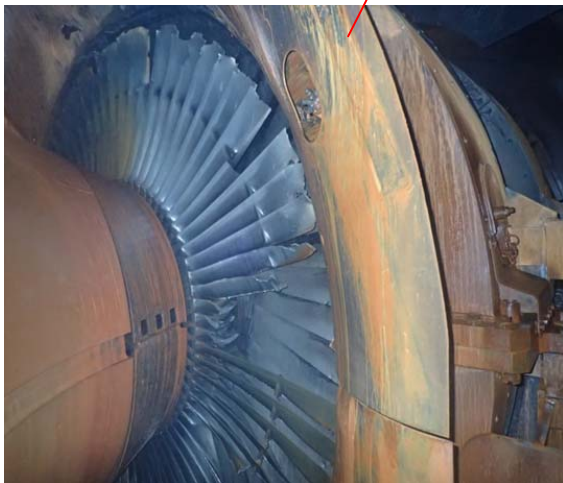
タービン翼損傷状況