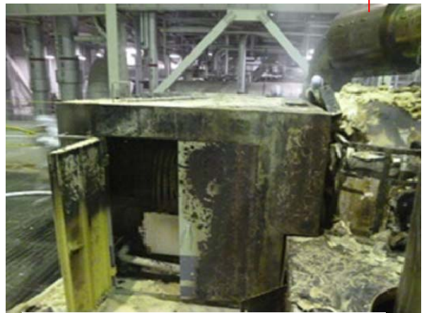
タービン前方付近焼損状況