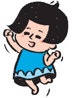
北陸電力キャラクター りこに