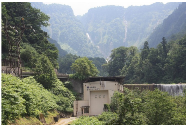
称名川第二発電所 全景