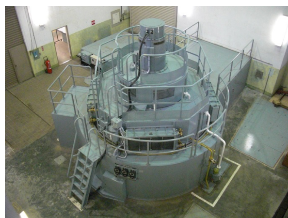
称名川第二発電所 発電機