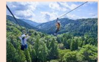
ツリーピクニックアドベンチャーいけだ