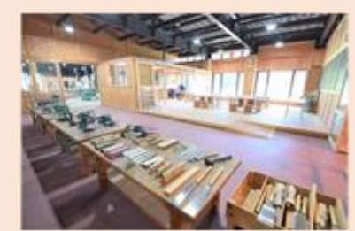
ウッズラボいけだ