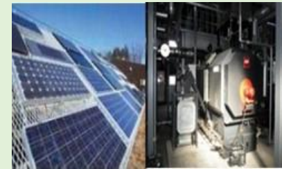
省エネルギーの促進