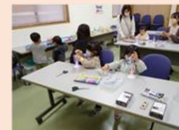
いけだ食の文化祭