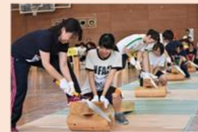
ウッズスポーツ選手権大会