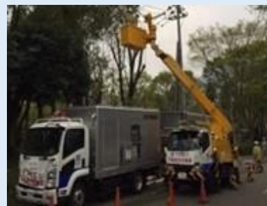
災害時の停電復旧作業