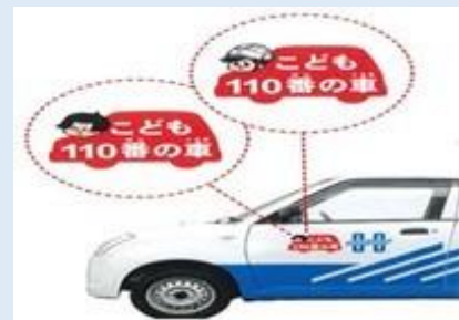
こども 110 番の車