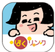
「ほくリンクアプリ」アイコン